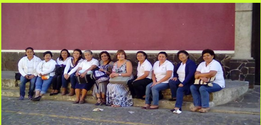
A experiência com as irmãs e irmãos de El Salvador foi inesquecível e de muita importância para a CMMALC