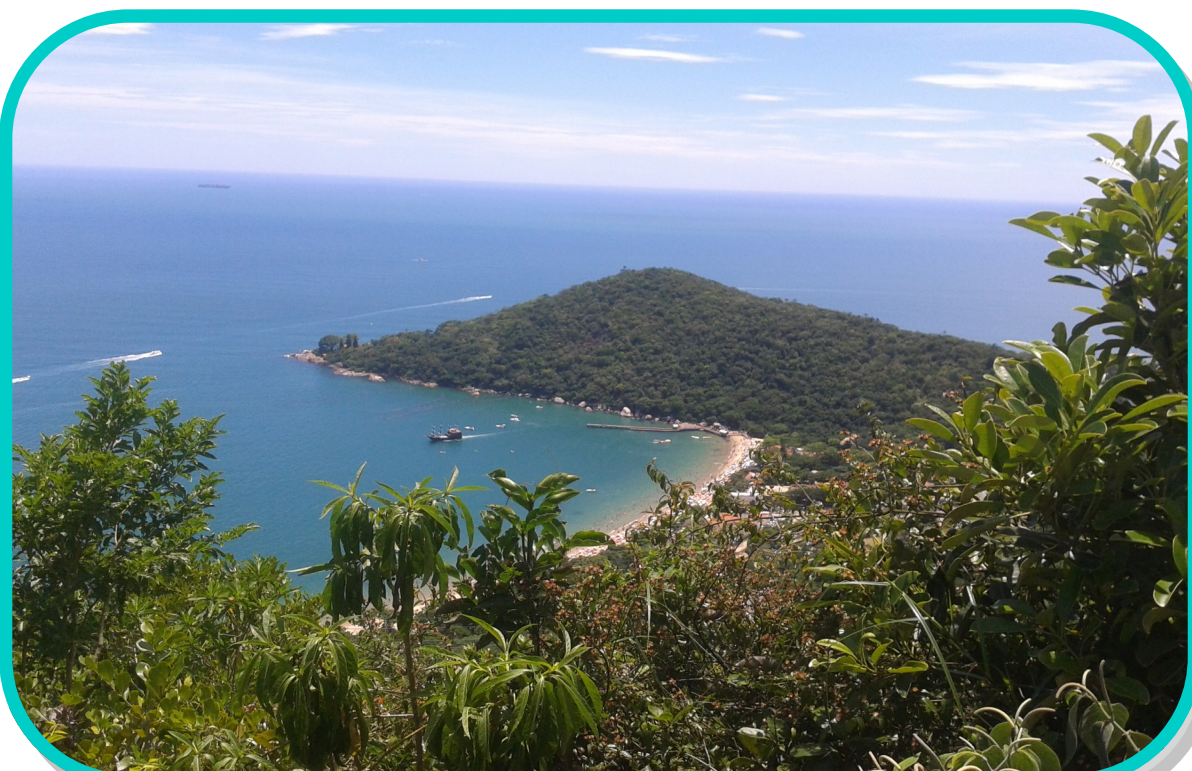
Florianópolis - Santa Catarina -Brasil