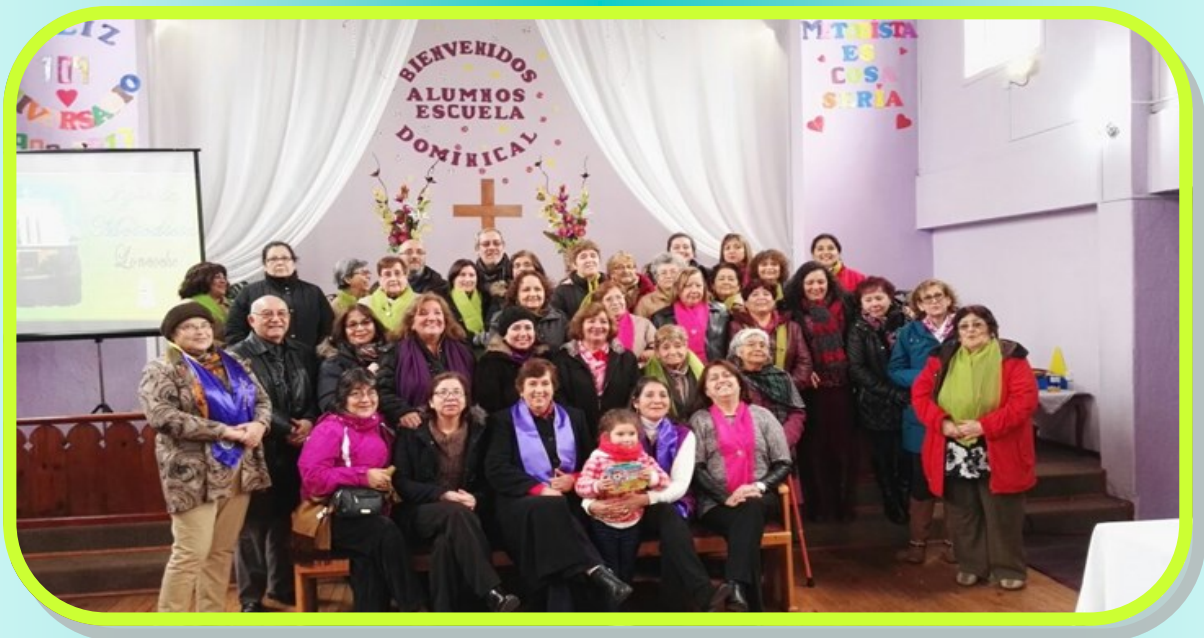
Irmãs do Circuito, Distrito Sul