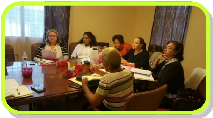
Primeira Reunião da Junta Diretiva a Nível Nacional e Oficina com o Tema: Princípios de Liderança em nossos Ministérios.