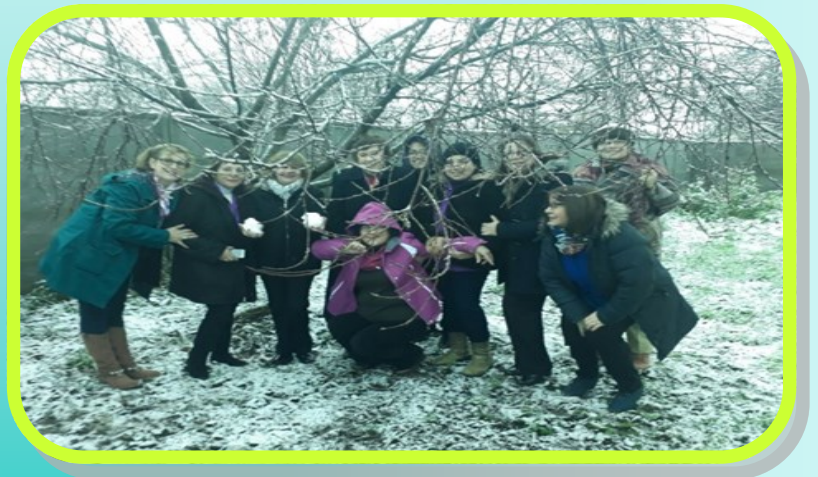
Desfrutando da neve antes de iniciar a sessão